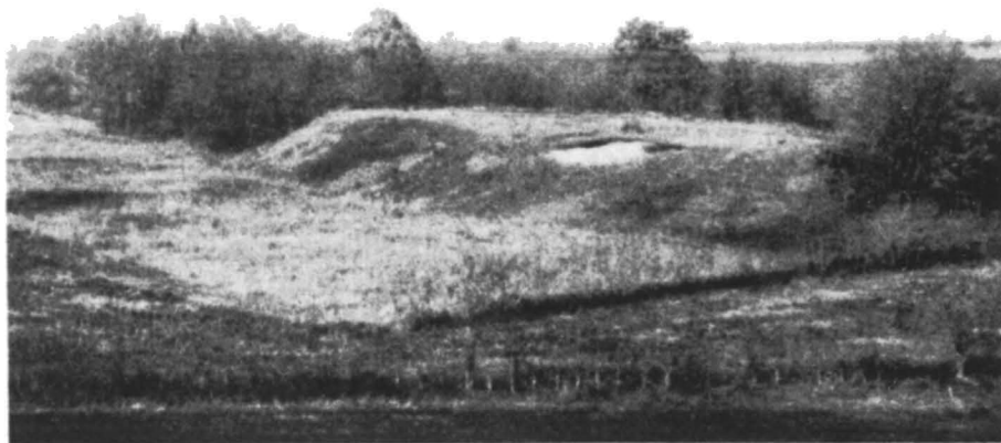
Fig. 1. — Vedere generală a așezării.

Oamenii din vechime și-au ales drept loc de așezare un bot de terasă aproape dreptunghiulară, cu dimensiunile de circa 70 m lungime și 40 m lățime, înconjurat de trei părți de pantă abrupte. Panta împădurită, dinspre valea Cetățuiei, are circa 12 m înălțime, iar panta de sud-est, dinspre Valea Ascunsă, are circa 7 m înălțime. Pe partea de legătură cu restul terasei se văd urmele evidente a două șanțuri de apărare, unul mai larg (de circa 12 m), dar cu adâncime mai redusă, și altul exterior, care taie și suprapune capătul de sud-est al primului șanț. După aspect, cel puțin primul șanț este contemporan cu așezarea neolitică. De-a lungul șanțului nu se observă nici un loc cruțat